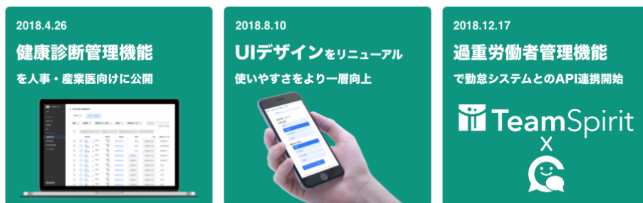
図2：2018年のCarelyのサービスアップデート回数